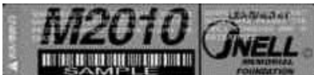
(USA) SNELL M2010

Los cascos deberán ser marcados con pintura o un sticker que no sea fácil remover